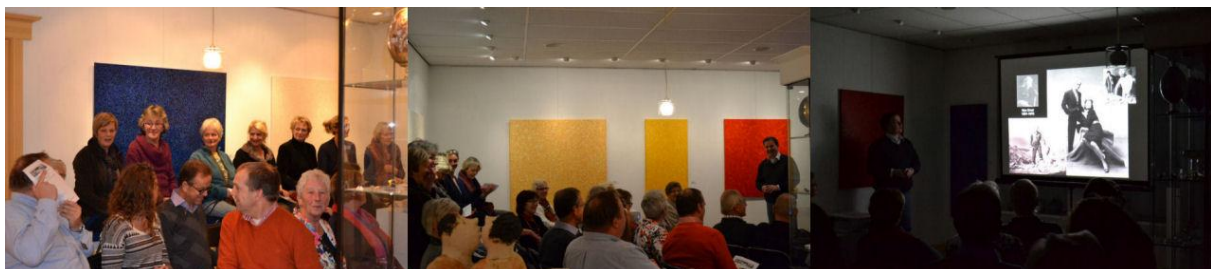
De cursusgroep van 2013 in de verduisterde galerie waar de powerpointlezings plaatsvinden